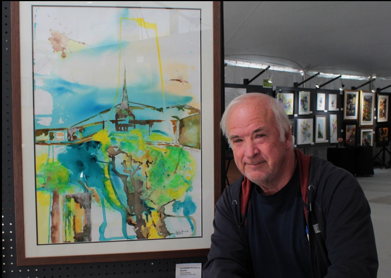
La Visitation du Sault au Récollet Christine Boisvert 2011